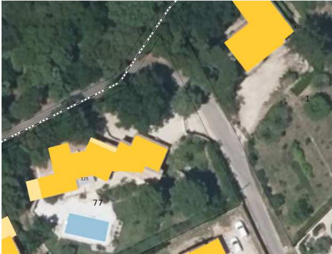
Liste des titulaires de droit de la parcelle AY 0077 (VAUCLUSE ; SERIGNAN-DU-COMTAT)

VC 7 : Chemin des Taillades Chemin déplacé au droit de la parcelle AY 77