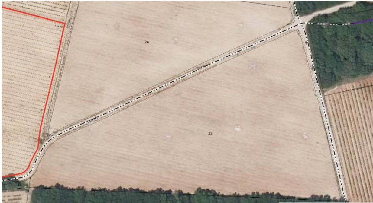
Liste des titulaires de droit de la parcelle AO 0025 (VAUCLUSE ; SERIGNAN-DU-COMTAT)

A la demande du propriétaire des parcelles AO 24 et 25, déplacement du chemin en limite Sud de la parcelle 25