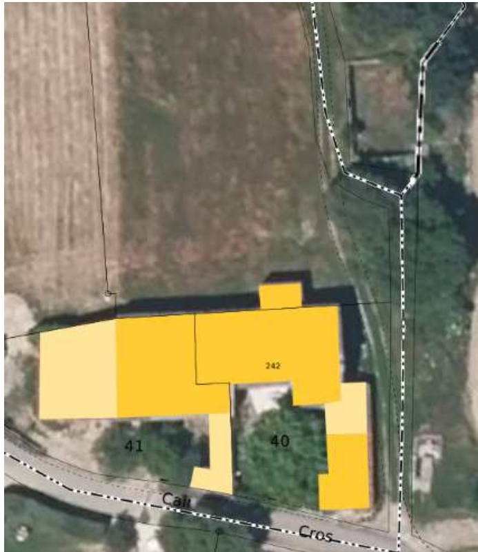
Liste des titulaires de droit de la parcelle AC 0039 (VAUCLUSE ; SERIGNAN-DU-COMTAT)

Chemin déplacé au droit des parcelles AC 39 et 40