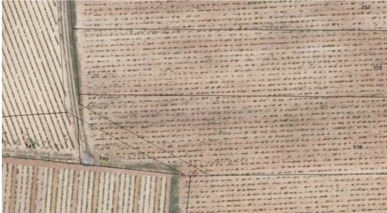
Liste des titulaires de droit de la parcelle D 0340 (VAUCLUSE ; SERIGNAN-DU-COMTAT)

Chemin rural n°78 Chemin déplacé en limite entre les parcelles D 340 et 341