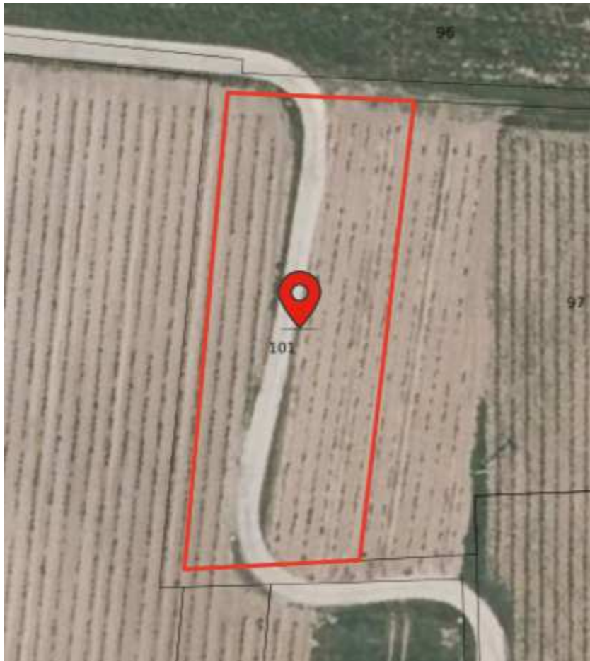
Liste des titulaires de droit de la parcelle AX 0101 (VAUCLUSE ; SERIGNAN-DU-COMTAT)

Chemin déplacé au droit des parcelles AX 101 et 102