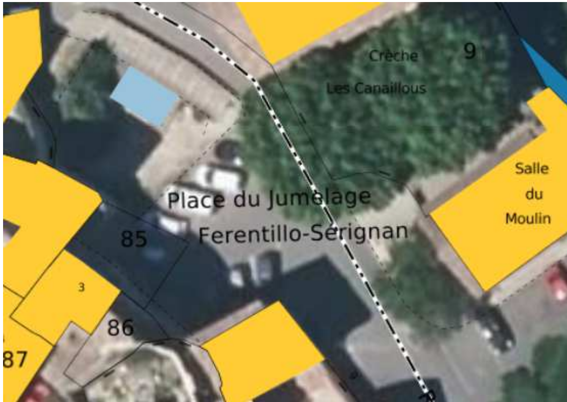
Liste des titulaires de droit de la parcelle BH 0085 (VAUCLUSE ; SERIGNAN-DU-COMTAT)

VC 212 : Place du Jumelage Ferentillo-Sérignan Erreur cadastrale à rectifier